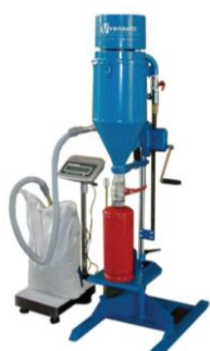
NAPEŁNIANIE GAŚNICZY PRZENOŚNEJ Z ZASTOSOWANIEM WAGI ETW100