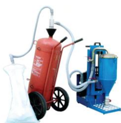
NAPEŁNIANIE GAŚNICZY NA KOŁACH Z ZESTAWEM Z PRZEDŁUŻACZEM "VENTURI"