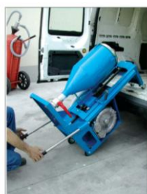
ŁATWE ZAŁADOWYWANIE/WYŁADOWYWANIE Z AKCESORIUM ACC/ADA130

> PER MAGGIORI INFORMAZIONI: FOR FURTHER INFORMATION CONTACT: POUR INFORMATIONS CONTACTER: