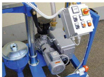
SZCZEGÓŁ PANELU ELEKTRYCZNEGO I POMPY PROŻNIOWEJ