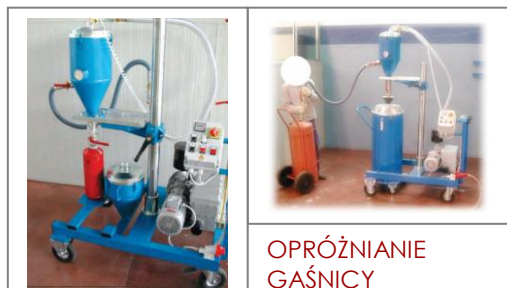
NAPEŁNIANIE GAŚNIC PRZENOŚNYCH