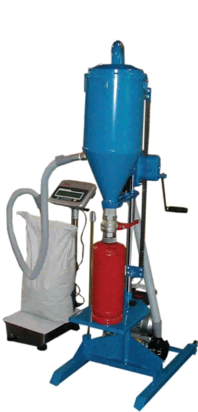
ETW100 z modelem TOTEM TS napełnianie gaśnic proszkiem gaśniczym